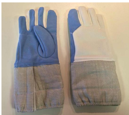
Guantes de sable