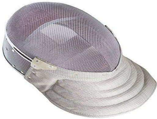
Careta de sable