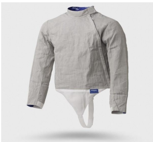
Chaquetilla eléctrica de sable

Los tiradores de Espada carecen de chaquetilla eléctrica, barbada conductora y pinza para la careta debido a su blanco válido. Además, sus pasantes están contruidos de manera diferente como se describe anteriormente. Sin embargo, poseen todos los otros componentes del equipo de un tirador de florete.