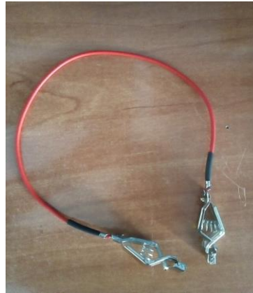
Pinza de careta de sable y florete

A la hora de apuntarse a un club para practicar Esgrima siempre hay un problema o una duda que pasa por la cabeza... ¿será un deporte caro? Pero sobre todo la duda más grande que uno tiene es dónde adquirir el material ya que se sabe que no hay productos de Esgrima visibles en ninguna tienda deportiva "convencional".