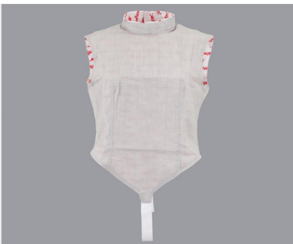
Chaquetilla eléctrica de florete