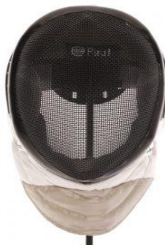
Caretta de florete con barbada eléctrica